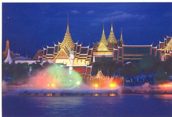
The Royal Palace at Celebration Bangkok

LA POSTA – Sfidando i “disastri orientali” Paolo Zazzeri ci saluta da Bangkok!!!