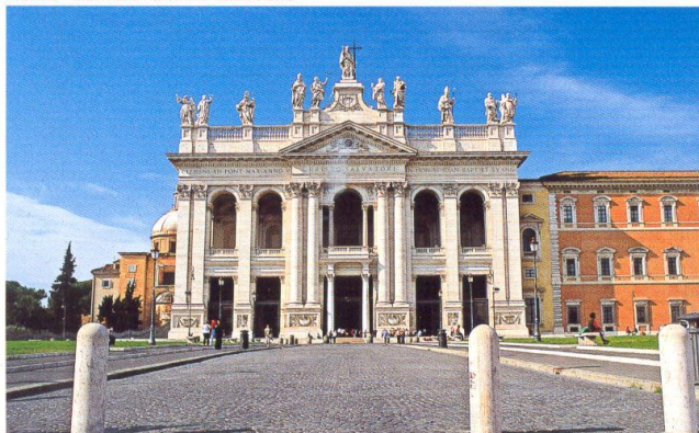
Roma - San Giovanni in Laterano

inviano gli auguri di buon 2012 a tutti gli amici.